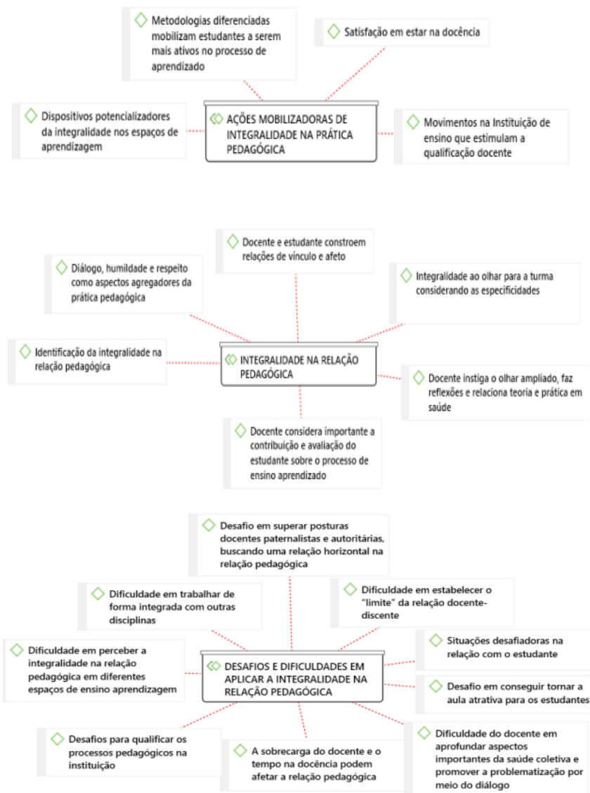
Figura 1 - Categorias Temáticas e subcategorias que emergiram no processo de análise qualitativa dos dados: