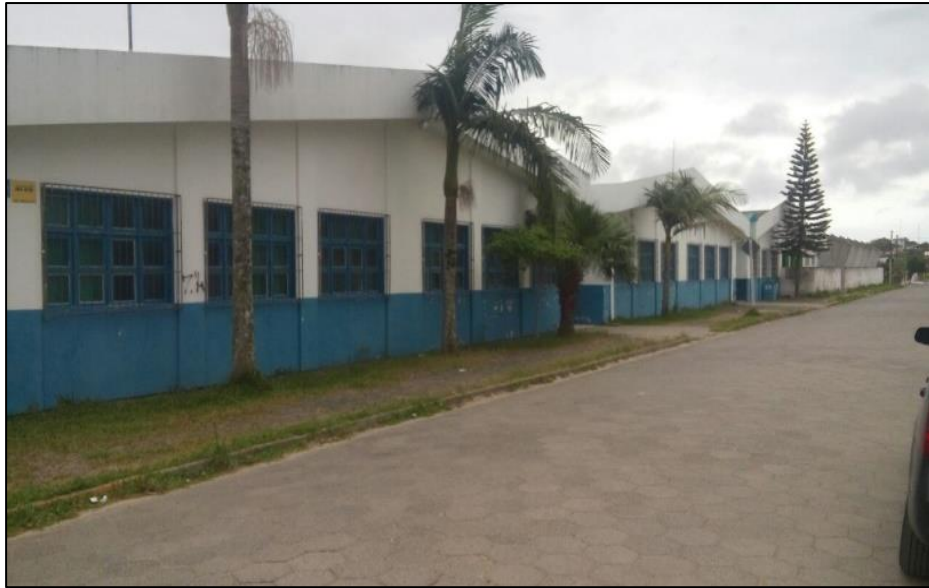
Imagem 11 - Escola Otavio Manoel Anastácio