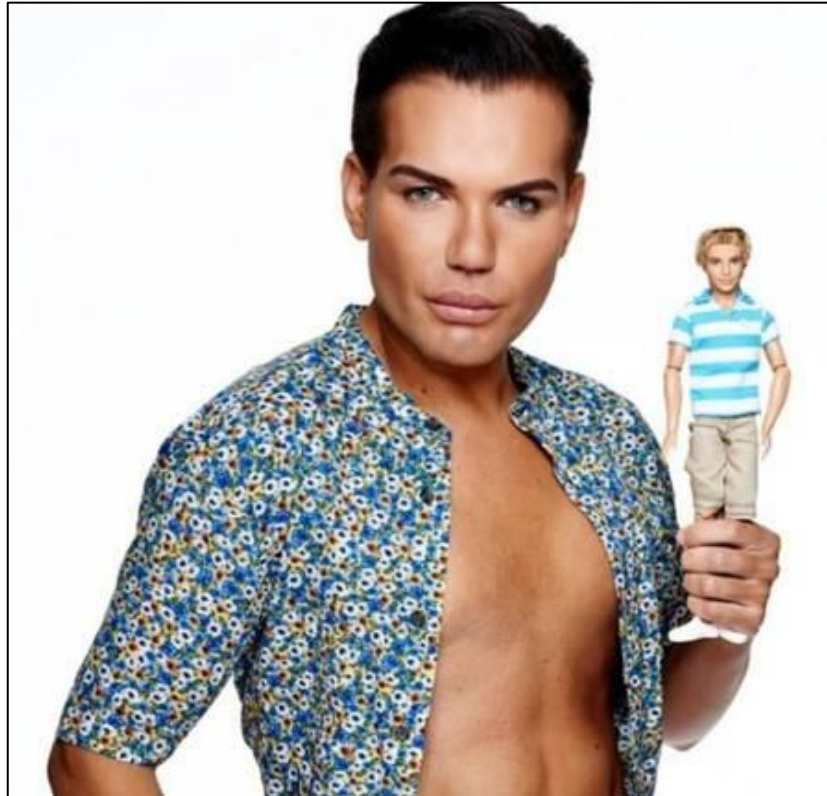
Imagem 6 - Ken Humano