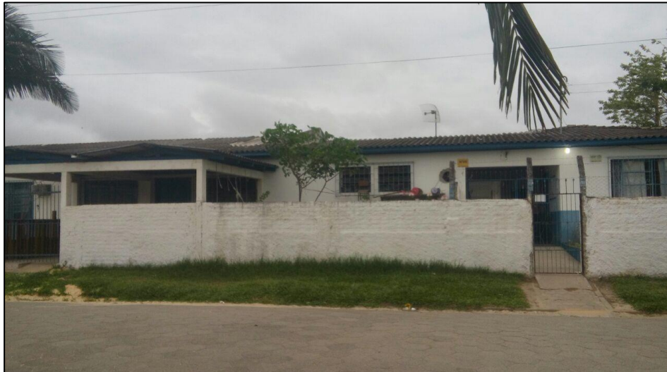
Imagem 10 - Antiga Escola Otavio Manoel Anastácio (Atual CEI)

Neste capítulo, trago parte da história da Escola Otavio Manoel Anastácio, no município de Araranguá. Os dados obtidos referentes a história da escola foram pesquisados no Projeto Político Pedagógico da escola e também alguns relatos de das primeiras professoras que ajudaram, pela existência da escola. Me alegra escutar as pessoas contando como se originou a escola onde estudei e me formei no ensino fundamental e onde hoje faço a pesquisa de campo para o meu trabalho de conclusão de curso.