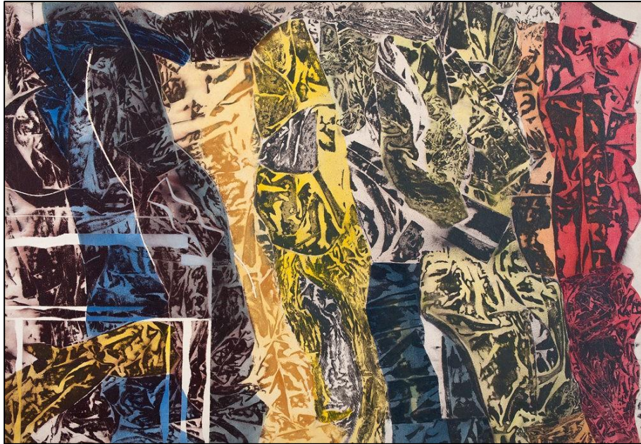
Imagem 7 - Artista Carlos Vergara (Monotipia, sobre lona Crua)