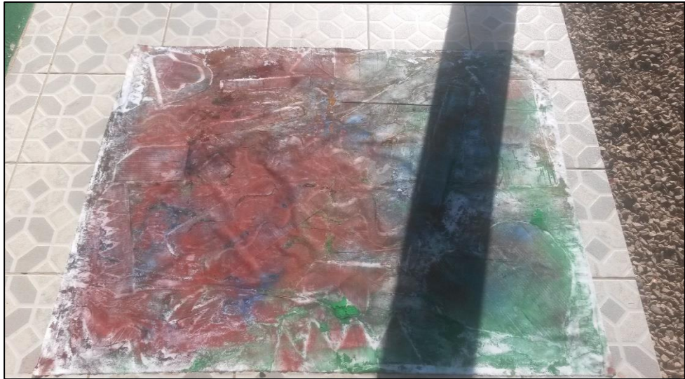
Imagem 9 - Produções dos alunos do 7 ano do Ensino Fundamental