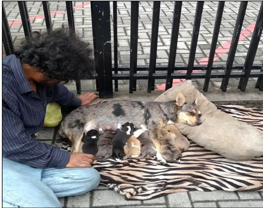
Imagem 4 - Amor Maior