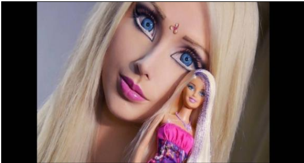
Imagem 5 - Barbie Humana