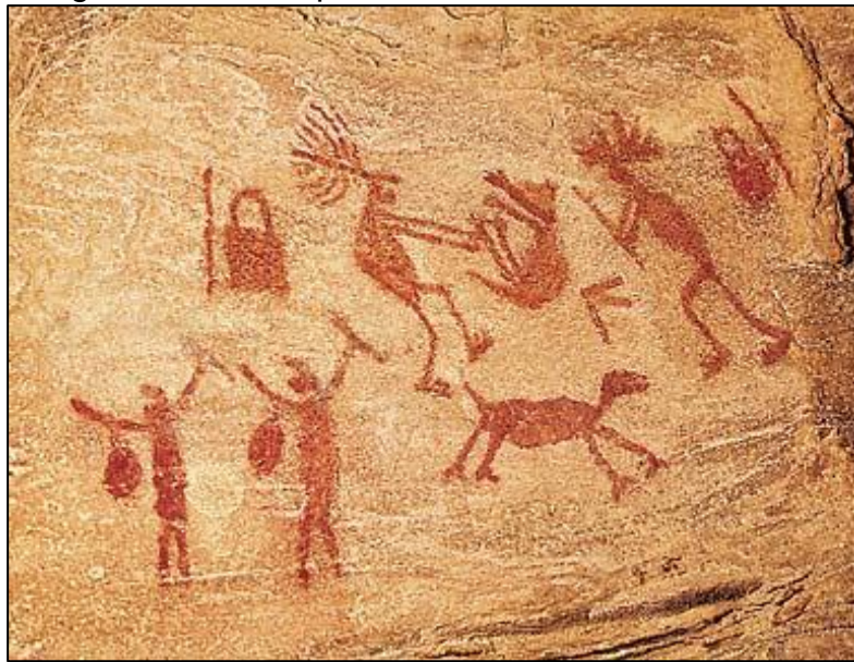
Imagem 1 - Arte Rupestre