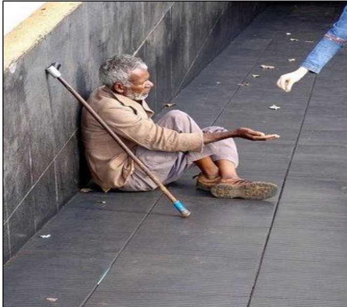
Imagem 3 - O Mendigo