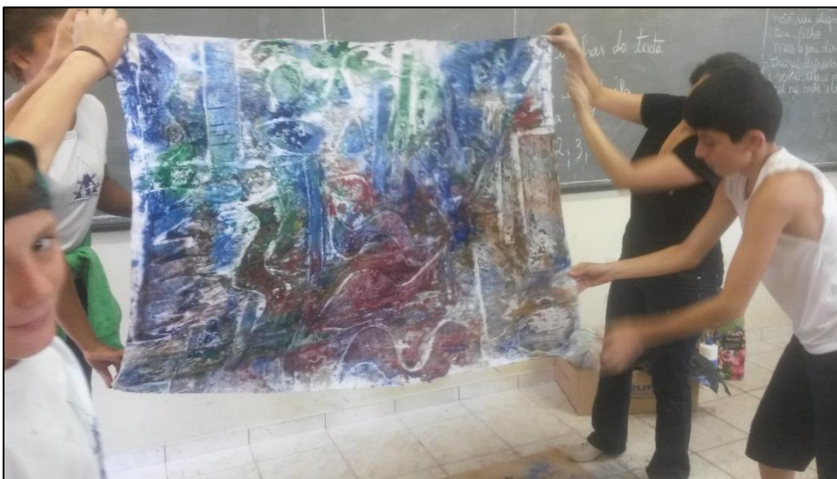
Imagem 8 - Produções dos alunos 7 ano do Ensino Fundamental