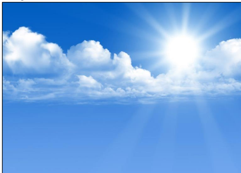
Imagem 2 - Céu Azul